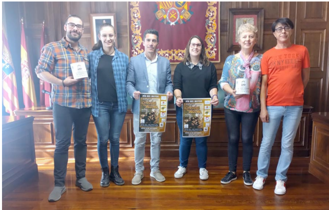
Presentación del acto programado para el 28 de septiembre en Teruel con motivo del Día del Mayor