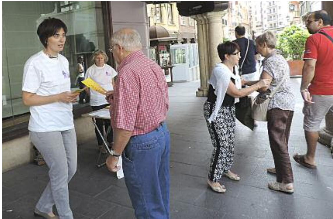
La mesa informativa de Alzheimer Teruel en septiembre del año pasado

La actividad formativa continuará el martes a la misma hora y en el mismo lugar. En este caso se expondrá La labor de las asociaciones de afectados. El presidente de Alzheimer Teruel comentará los programas que des-